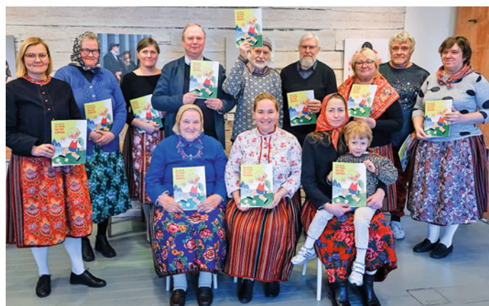
Kihnu Keelekoda on oma tõlketööga rahul.