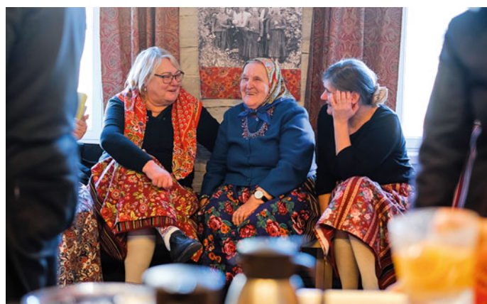
Mitmekesisel kultuurisündmusel oli vaatamist ja kuulamist palju.